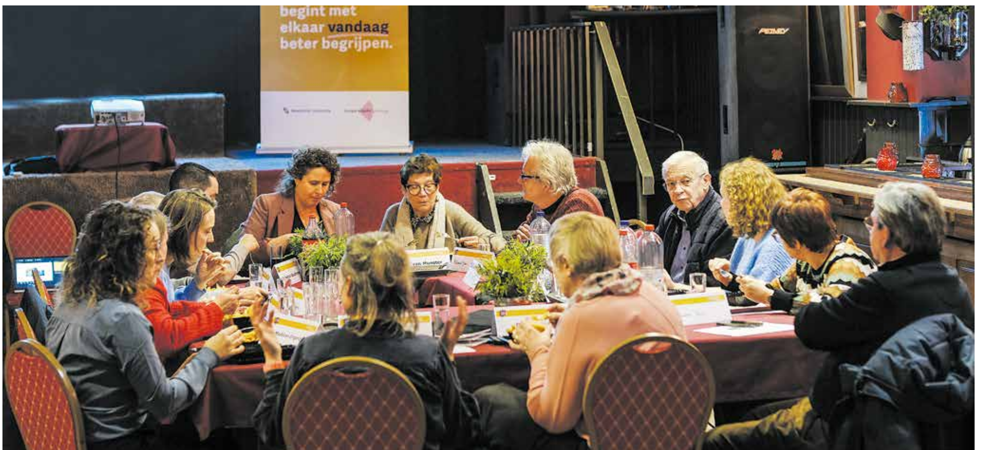
De onderzoekers en burgers samen in Heugem aan de friet