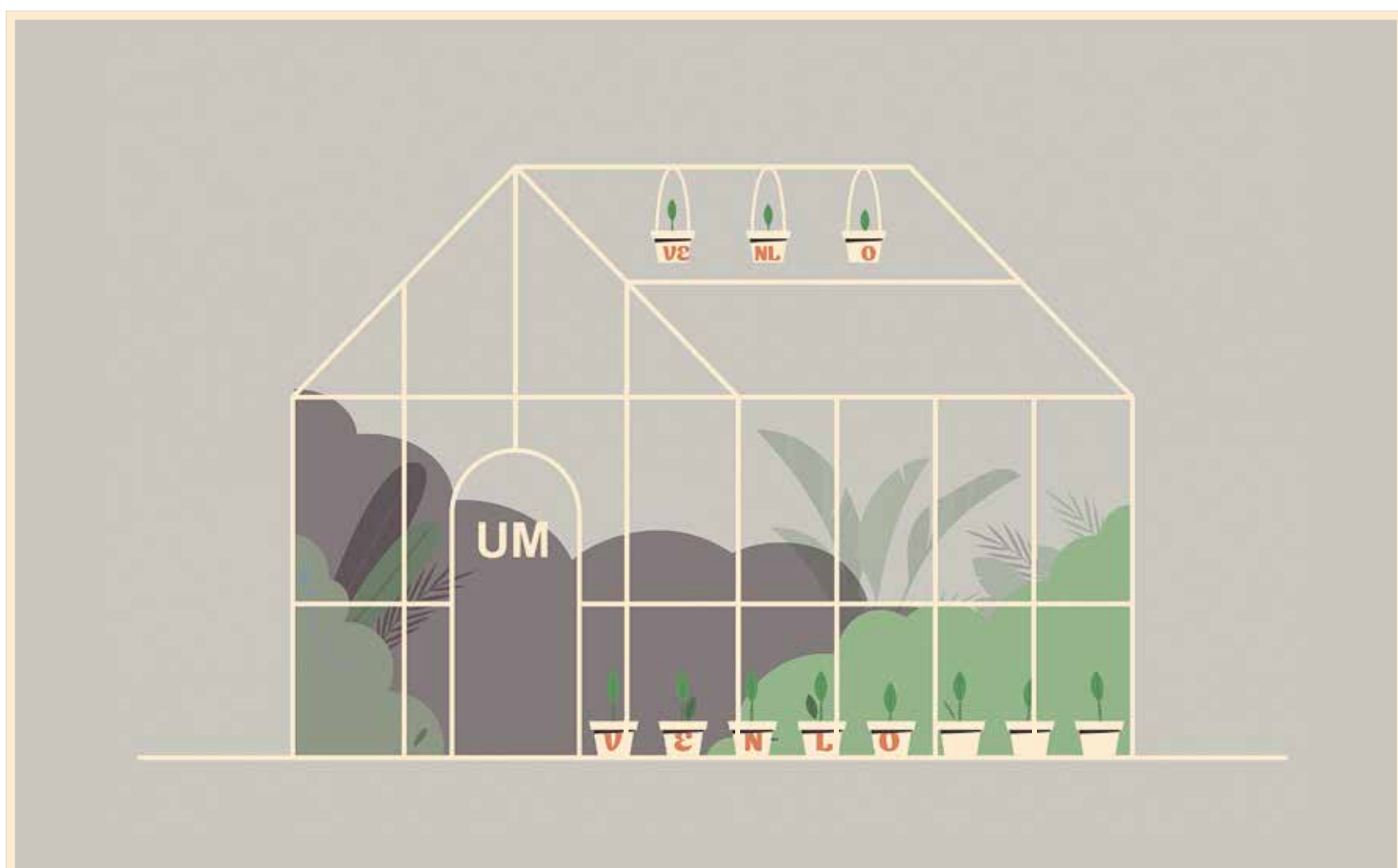
Illustratie: Freepik/Simone Golob