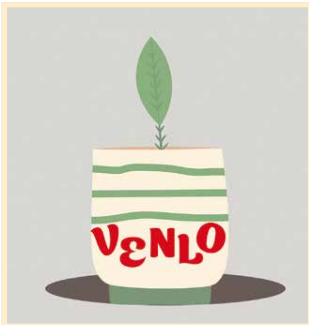
Illustratie: Simone Golob

Toch brengt dat pionieren ook risico's met zich mee. Ze zijn afhankelijk van externe geldschieters, zoals de provincie en gemeentes. Daarbij duurt het lang voordat er ‘massa’ is (kijk naar het studentenaantal in Venlo) en dan is er nog het gebrek aan